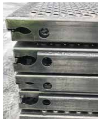
Art. nr. 2021164